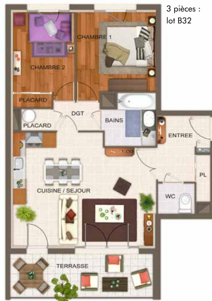
3 pièces : lot B32